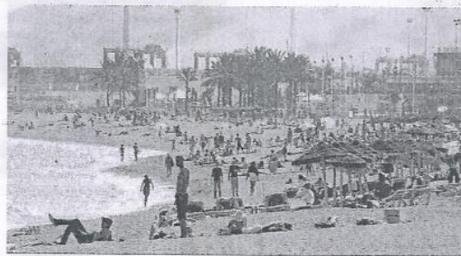
Numerosas personas en la playa de La Malagueta, la pasada semana.