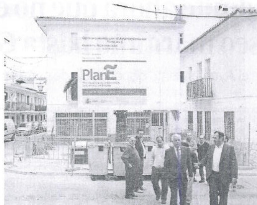
Yunquera. El subdelegado del Gobierno asistió a la colocación del cartel. MANUELA HERREROS