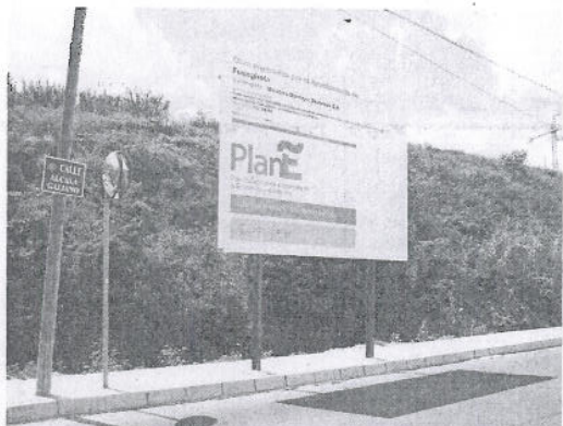
Fuengirola. Una de las vallas colocadas en el municipio.